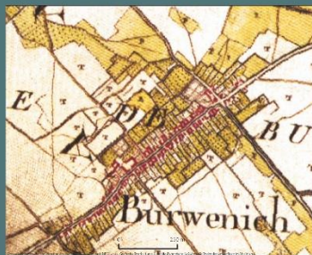
Ausschnitt aus der sogenannten Tranchkarte mit dem einstigen Klostergebäude.

Die 2011 bis 2015 durchgeführte Gesamtinstandsetzung der Pfarrkirche St. Stephani Auffindung hat wichtige Erkenntnisse zur Baugeschichte erbracht. Der heutige Saalbau ist das Ergebnis zahlreicher Umbauten und geprägt von der Zeit als Nonnenkirche der hier ab dem 13. Jahrhundert wirkenden Zisterzienserinnen. Die Spuren im Mauerwerk und Boden erzählen die spannende Geschichte dieses Baus – von den Anfängen im Mittelalter bis zur Aufhebung des Klosters Anfang des 19. Jahrhunderts.