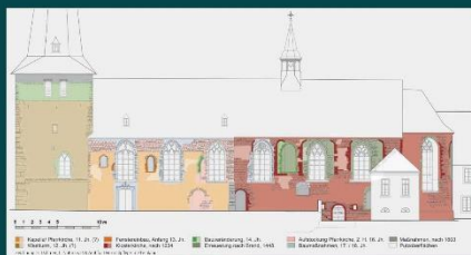
Südseite der Kirche. Befund- und Baualterskartierung.